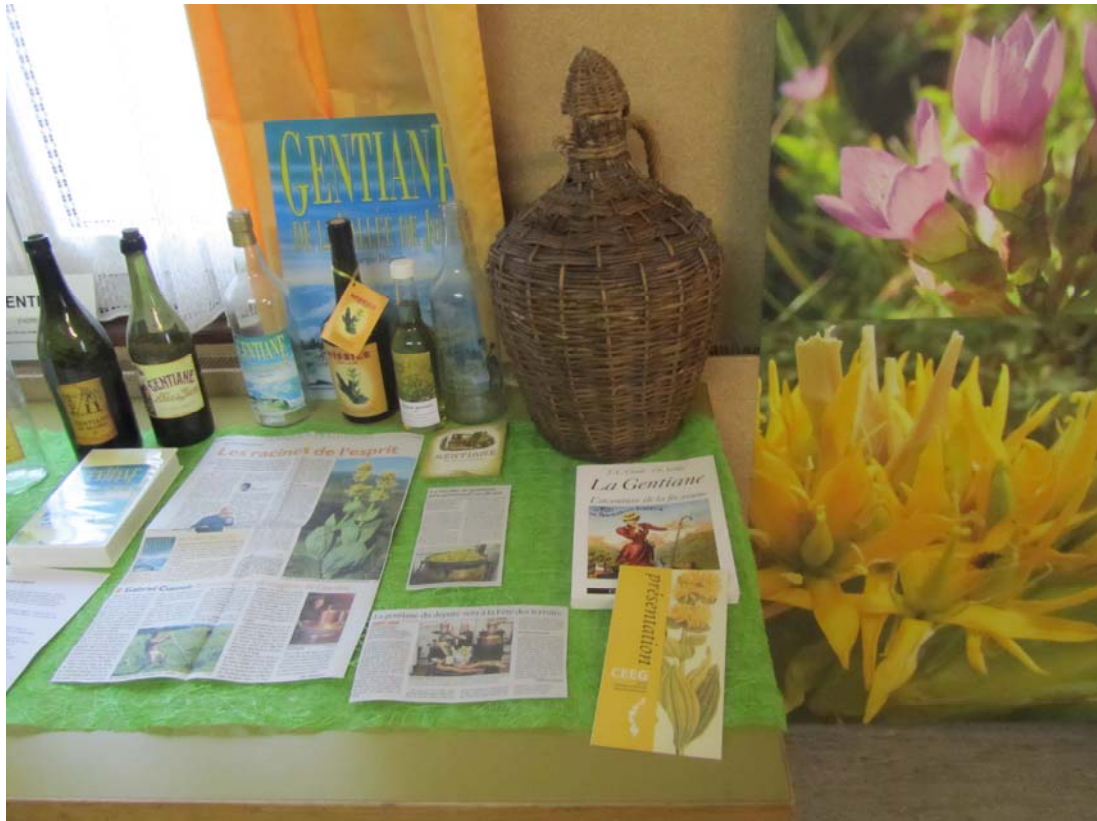
Bouteilles, articles et ouvrage consacré au Jura.