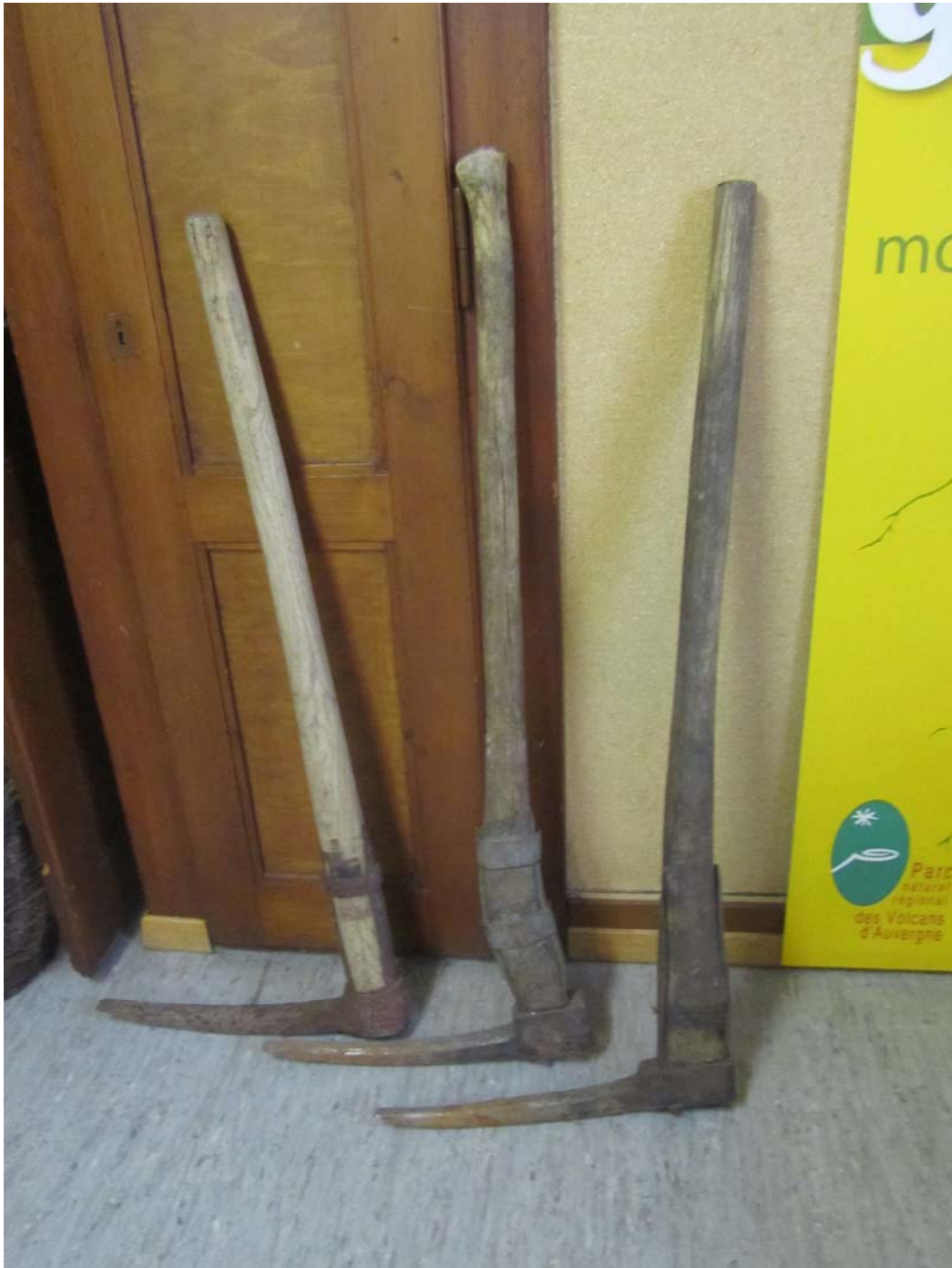
Divers pics pour l'extraction de la gentiane.

A l'occasion de ces festivités du printemps 2013, du samedi 1 er juin 2013 pour être précis, tenues aux Charbonnières, local des sociétés et église, une exposition fut organisée à la petite salle de la grande salle ! Cet aperçu des documents divers en rapport avec l'histoire de cette plante, mais surtout de la distillation de sa racine, mérite plus qu'une exhibition passagère. Raison pour laquelle nous vous proposons aujourd'hui de retrouver cette exposition par le biais de nos photos.