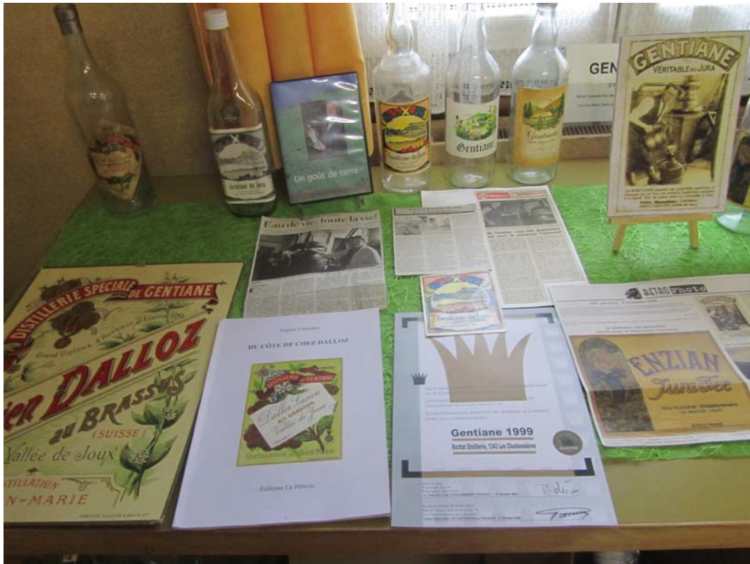
Quelques bouteilles, une affiche Dalloz, une publication sur cette honorable maison et différents articles consacrés à nos bouilleurs de cru dans nos journaux régionaux.