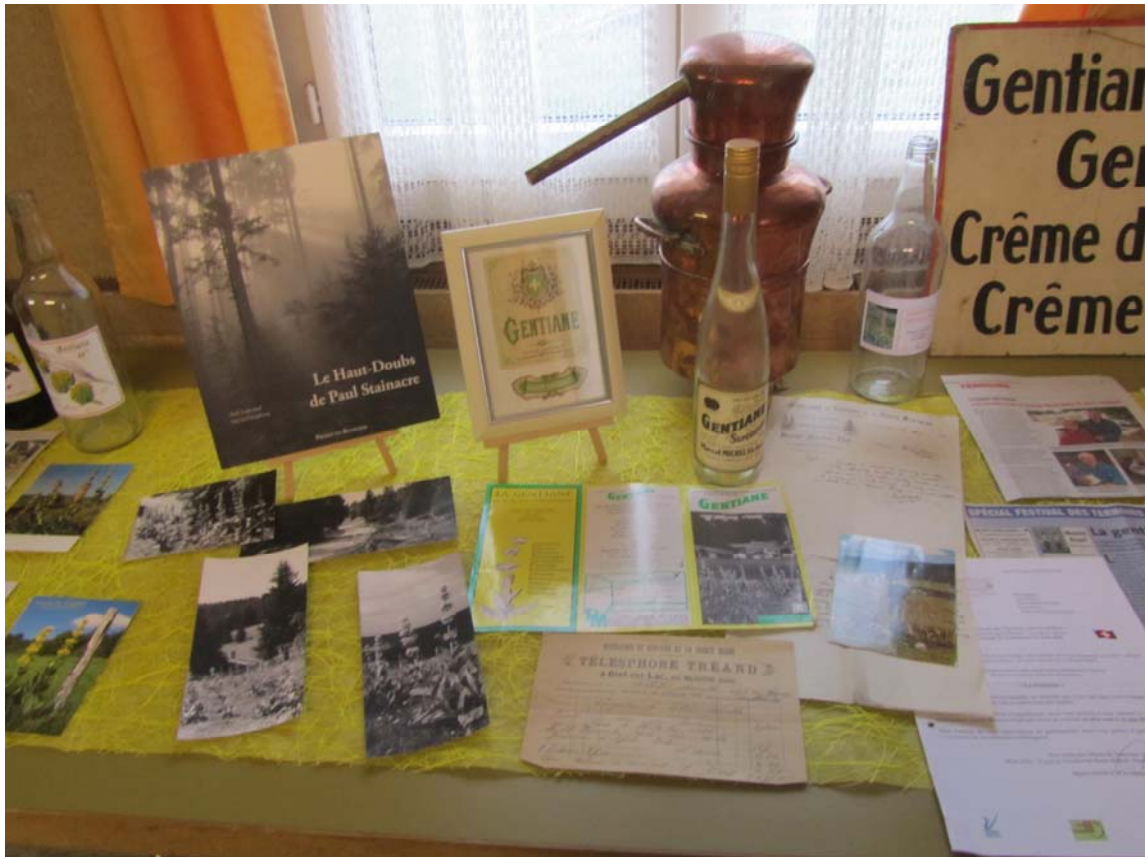
Et l'on poursuit cette simple mais magnifique exposition.