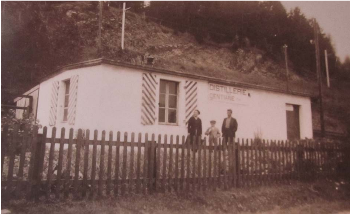
Une exposition qui nous permet de découvrir la distillerie de René Meylan père, située aux Crettets, aux Charbonnières. La maison du même sera plus tard élevée directement sur ce modeste bâtiment.